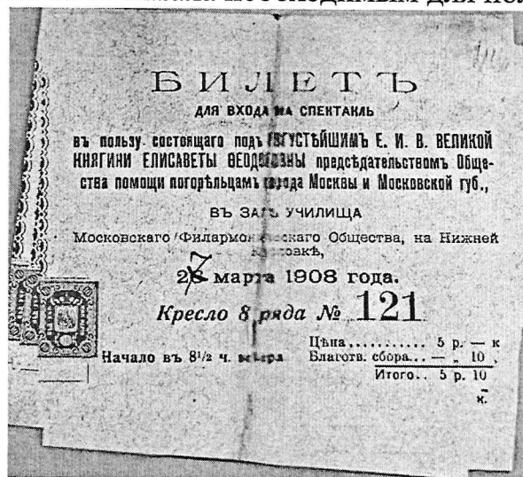
Билет на благотворительный спектакль в помощь погорельцам.