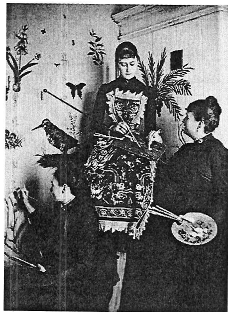
Великая княгиня Елизавета Федоровна за занятиями живописью. Конец 1880-х гг.