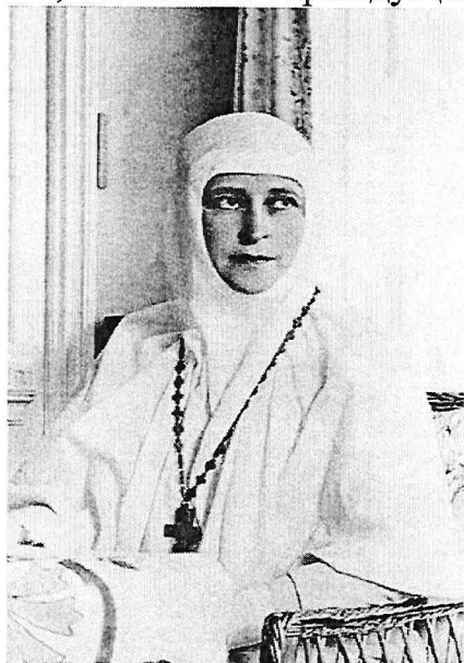
фото Великая княгиня Елизавета Федоровна — настоятельница Марфо-Мариинской обители милосердия. 1910-е гг.

Великая княгиня была утверждена в должности настоятельницы. Деятельность Марфо-Мариинской обители была обращена в поддержку бедных, больных и страждущих.