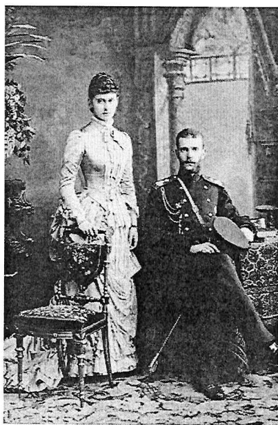
Супруги великий князь Сергей Александрович и великая княгиня Елизавета Федоровна.

После замужества и переезда в Россию для Великой княгини все предстало внове: и язык, и быт, и русское православие. Раньше мир юной принцессы из маленького немецкого герцогства умещался в границах владений немецких и английских родственников. А теперь, после замужества, она оказалась в огромной стране, которую предстояло узнать и полюбить. Проводником в "новый мир" стал для Эллы любимый муж. Она приняла новое имя – Елизавета Федоровна (по традиции, все немецкие принцессы получали это отчество в честь Феодорской иконы Божьей Матери).