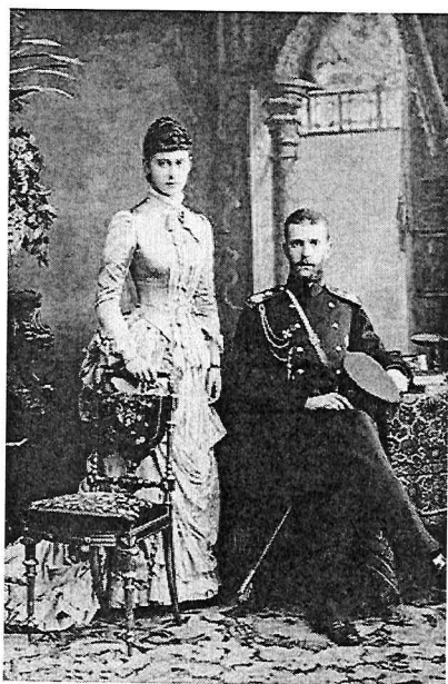
Супруги великий князь Сергей Александрович и великая княгиня Елизавета Федоровна.

После замужества и переезда в Россию для Великой княгини все предстало внове: и язык, и быт, и русское православие. Раньше мир юной принцессы из маленького немецкого герцогства умещался в границах владений немецких и английских родственников. А теперь, после замужества, она оказалась в огромной стране, которую предстояло узнать и полюбить. Проводником в "новый мир" стал для Эллы любимый муж. Она приняла новое имя – Елизавета Федоровна (по традиции, все немецкие принцессы получали это отчество в честь Феодорской иконы Божьей Матери).