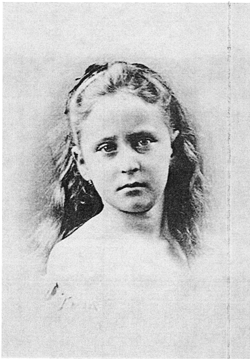
фото Принцесса Гессенская и Великобританская Элла. Начало 1870-х гг.

Предоставленный методический материал о жизни и деятельности Елизаветы Федоровны является обзорно-рекомендательным и поможет учителю самостоятельно определить содержание урока.