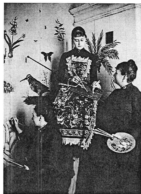
Великая княгиня Елизавета Федоровна за занятиями живописью. Конец 1880-х гг.