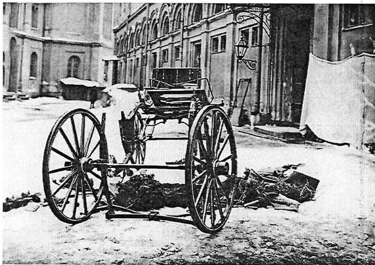
Остатки кареты великого князя Сергея Александровича после взрыва

Но 4 (17) февраля 1905 года Елизаветы Федоровны не оказалось рядом. В карету, где находился Великий князь Сергей Александрович, бросили бомбу. Мужество, с которым она встретила смерть мужа, поразило многих.